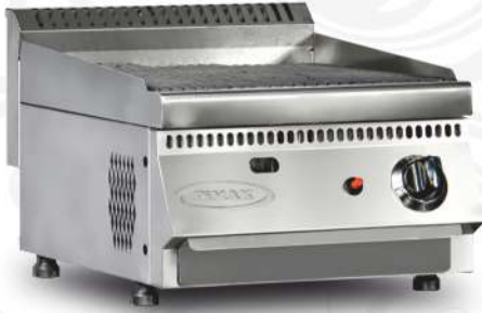
70S-M190-60 Sulu Tip | Watery